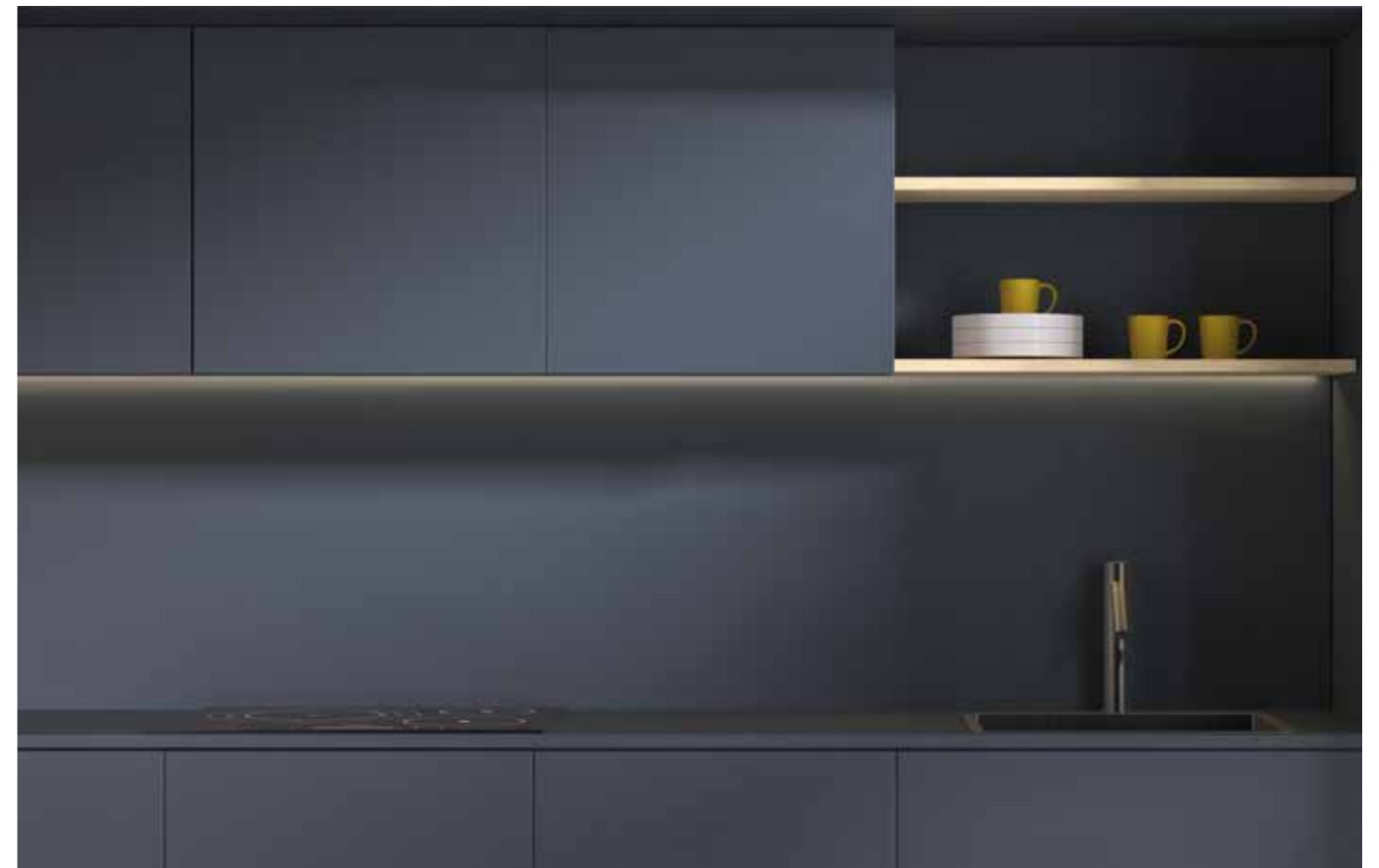
Küche durchgeführt in Azul Ceylan

Diese Serie von ultramatten Anti-Fingerprint-Designs mit samtweichem Touch ist für den Kontakt mit Lebensmitteln geeignet und kann auf horizontalen und vertikalen Oberflächen verwendet werden.